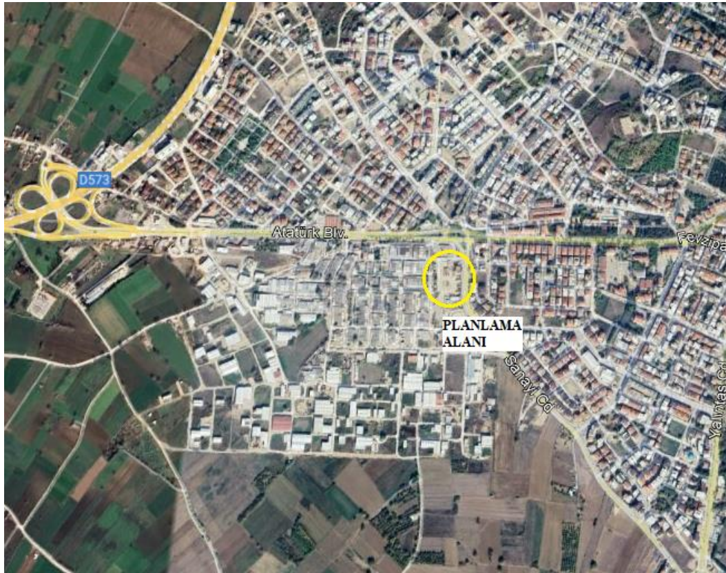
Şekil 1: Planlama alanı (Google earth'den alınmıştır)

Alanın doğusunda 22 m, batısında 15 m ve kuzeyinde 12 m en kesitli ulaşım aksları bulunmaktadır. Doğu ve batıdaki yollar kuzeyde 30 m en kesitli Atatürk Bulvarına bağlanmaktadır.