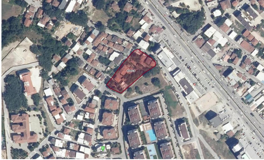
Harita 2:Planlama Alanı Yakın Çevresi Uydu Görüntüsü