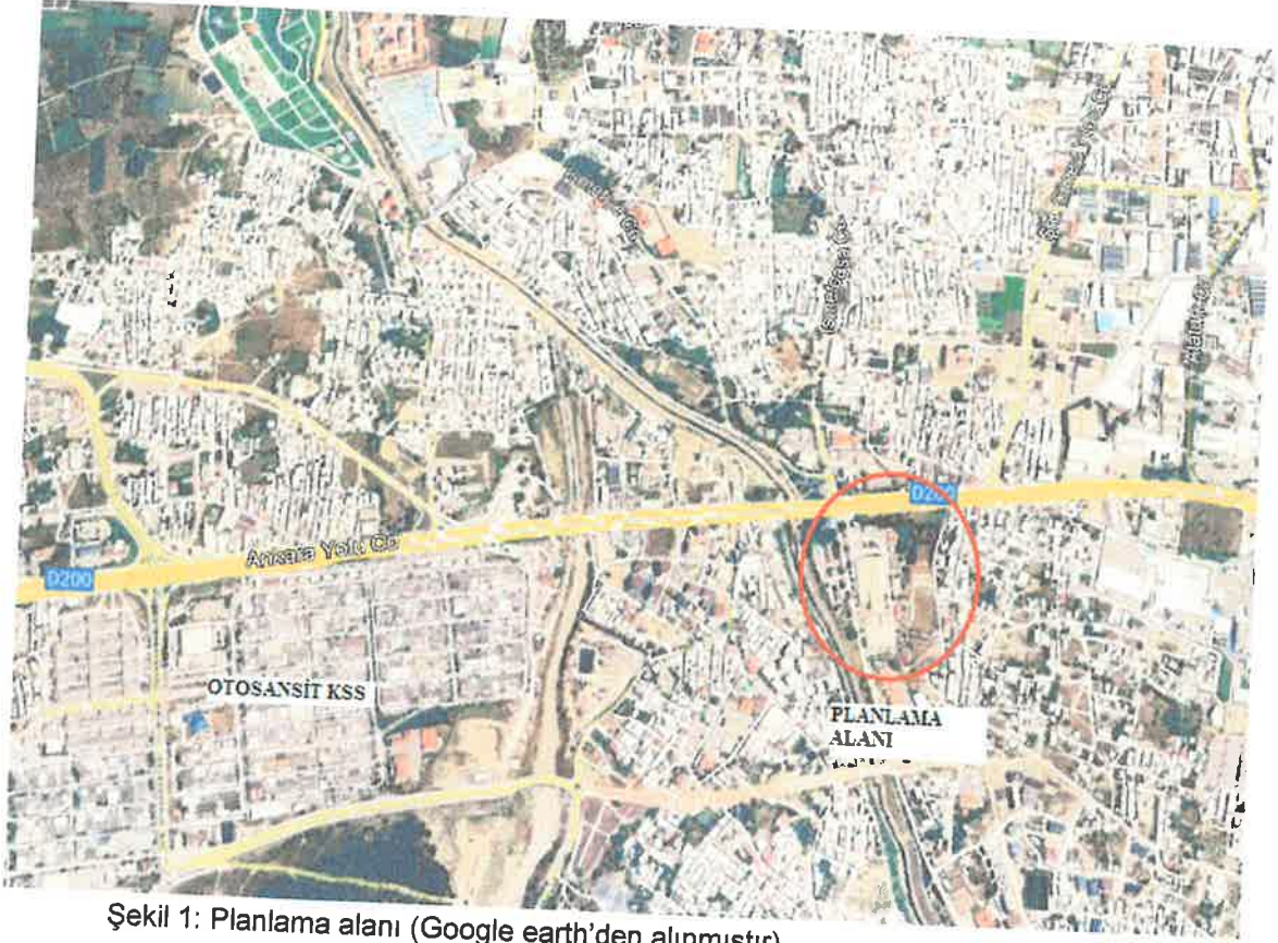
Şekil 1: Planlama alanı (Google earth'den alınmıştır)