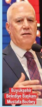
Büyükşehir Belediye Başkanı Mustafa Bozbey

□ Meclis üyeleriyle iftarda bir araya gelen Büyükşehir Belediye Başkanı Mustafa Bozbey, 'birlik' mesajı verdi. Merinos Atatürk Kültür Merkezi'nde düzenlenen iftar programına, Büyükşehir Belediye Başkanı Mustafa Bozbey ve eşi Seden Bozbey, belediye başkanları, meclis üyeleri ve Büyükşehir Belediyesi yöneticileri katıldı. İftarda konuşan Başkan Bozbey, mecliste yaşanan görüş ayrılıklarına rağmen Bursa'nın geleceği için ortak akla hareket edilmesi gerektiğini söyledi. Başkan Bozbey, "Mecliste zaman zaman gerginlikler yaşanabiliyor. Ancak biz akadaşız. Biz, Bursalıyız. Bursa'nın havasını soluyoruz, aynı şehirde beraber yaşıyoruz. Omuz omuza yaşıyoruz. Kent adına tartışmalar yapabiliriz. Bursa'nın sorunlarını çözme nok-