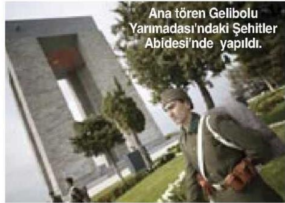
Ana tören Gelibolu Yarımadası'ndaki Şehitler Abidesi'nde yapıldı.