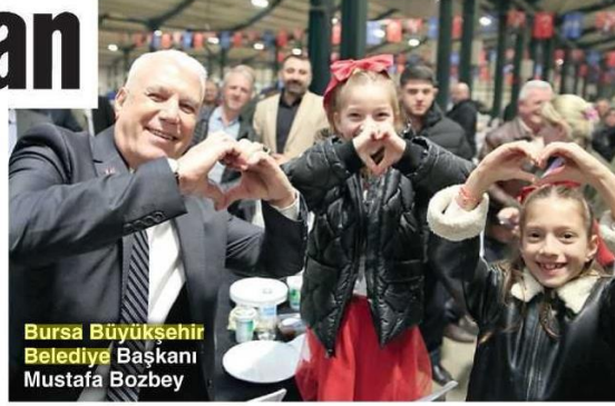
Bursa Büyükşehir Belediye Başkanı Mustafa Bozbey

Bursa Büyükşehir Belediyesi , 11 ayın sultanı Ramazan'ın kentte huzur ve dayanışma içerisinde geçirilmesine bu yıl da öncülük edecek. İhtiyaç sahibi vatandaşlara Ramazan desteği verecek olan Bursa Büyükşehir Belediyesi , 17 ilçede toplam 28 ilçe iftarı düzenleyecek. Başkan Bozbey de iftar sofralarında Ramazan'ın manevi duygusunu ve bereketini Bursalılarla paylaşacak. Her yıl 3 sabit alanda belirlenen iftar noktaları bu yıl 4'e çıkarıldı. Emir Sultan, İshakpaşa BURULAŞ Otoparkı ve Fomara Fevzi Çakmak Katli Otoparkı'nın yanı sıra Değirmenönü Mahallesi'nde de