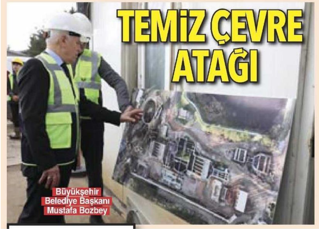
Büyükşehir Belediye Başkanı Mustafa Bozbey