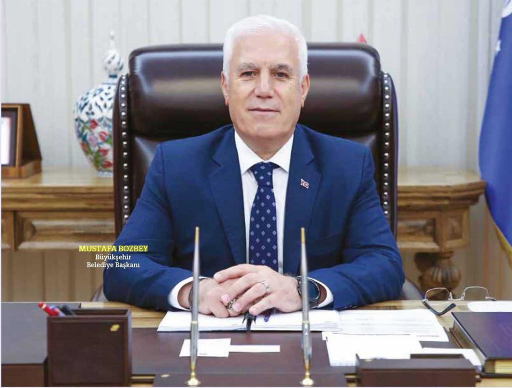
MUSTAFA BOZBEY Büyükşehir Belediye Başkanı