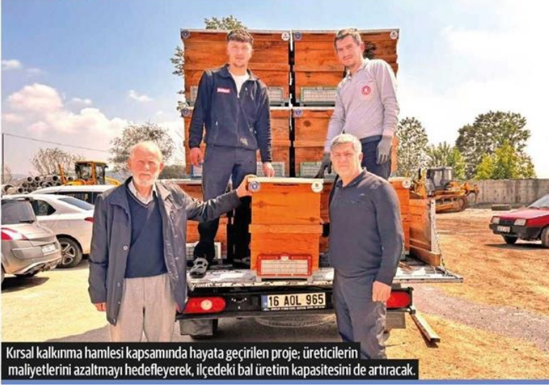
Kırsal kalkınma hamlesi kapsamında hayata geçirilen proje, üreticilerin maliyetlerini azaltmayı hedefleyerek, ilçedeki bal üretim kapasitesini de artıracak.

69 ÜRETİCİYE YÜZDE 50 HİBELİ KOVAN DAĞITILDI