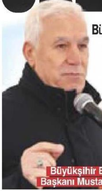
Büyükşehir Belediye Başkanı Mustafa Bozbey

Büyükşehir Belediyesi, küçükbaş hayvancılığı geliştirmek adına hayata geçirdiği yeni proje kapsamında ilk etapta 30 aileye 15'er koyun ve 1'er koç verecek.