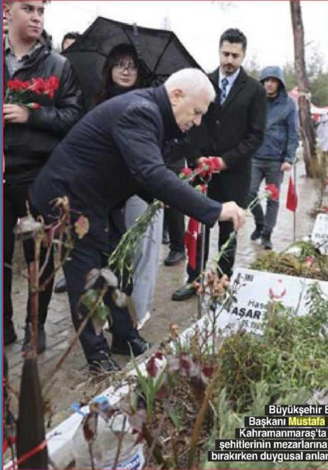
Büyükşehir Belediye Başkanı Mustafa Bozbey , Kahramanmaraş'ta deprem şehitlerinin mezarlarına karanfil bırakırken duygusal anlar yaşadı.

Büyükşehir Belediye Başkanı Mustafa Bozbey, CHP'nin 6 Şubat depremlerinin yıl dönümünde Kahramanmaraş'ta düzenlediği anma programına katıldı. Bozbey, "Yaraları birlikte sarıyoruz" dedi.