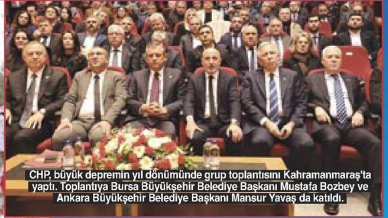
CHP, büyük depremin yıl dönümünde grup toplantısını Kahramanmaraş'ta yaptı. Toplantıya Bursa Büyükşehir Belediye Başkanı Mustafa Bozbey ve Ankara Büyükşehir Belediye Başkanı Mansur Yavaş da katıldı.