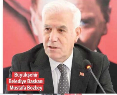
Büyükşehir Belediye Başkanı Mustafa Bozbey

Yıldırım'daki muhtarlarla buluşan Başkan Bozbey, 1/100.000'lik Çevre Düzeni Planı'nda sona geldiklerini belirterek, "Bursa'nın kentsel ihtiyaçlarının giderildiği, alt planlarıyla, kentsel dönüşüm planlarıyla örnek bir kent olabilesi için çalışıyoruz" dedi.