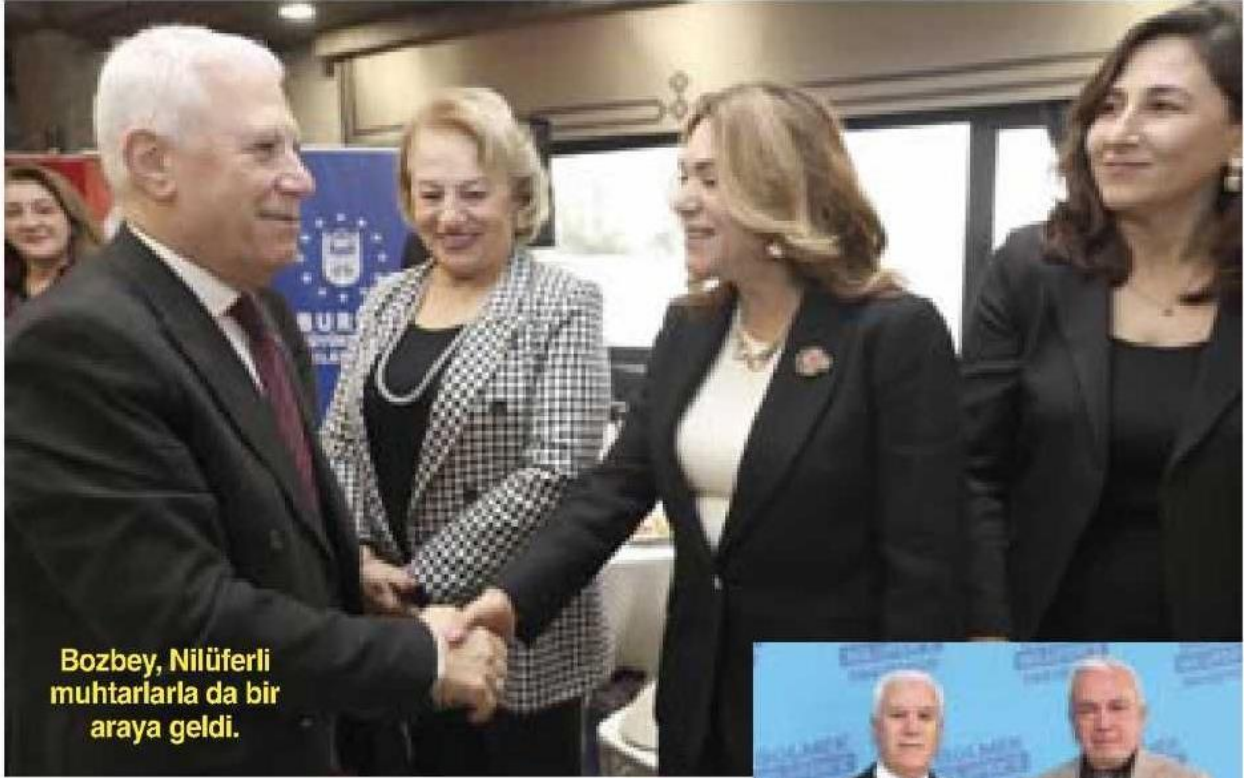
Bozbey, Nilüferli muhtarlarla da bir araya geldi.