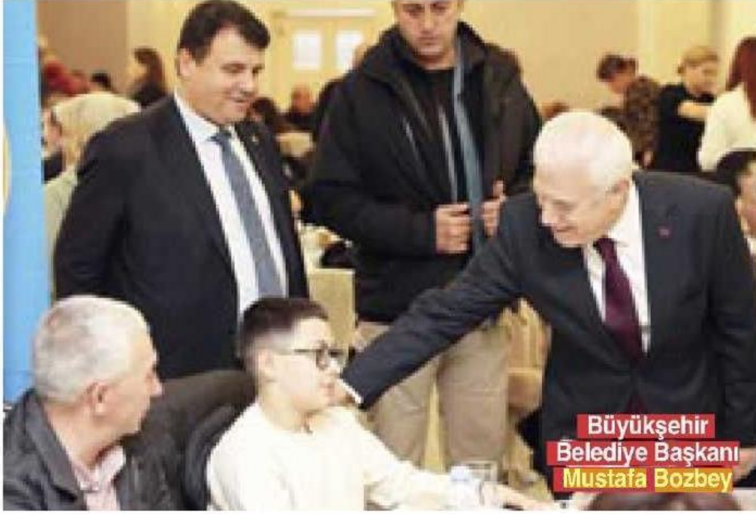
Büyükşehir Belediye Başkanı Mustafa Bozbey