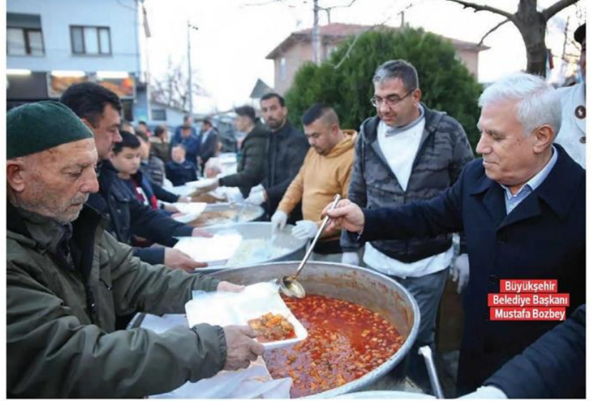
Büyükşehir Belediye Başkanı Mustafa Bozbey