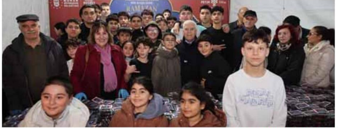
ekipler tarafından iftara yetişemeyen vatandaşlara iftariyelik dağıtılıyor.

Büyükşehir Belediyesi, geçtiğimiz yıl olduğu gibi bu yıl da Ramazan ayının bereketini, kentin tamamına yayıyor. Her yıl 3 sabit alanda belirlenen iftar noktalarını bu yıl 4'e çıkaran Büyükşehir Belediyesi, Emir Sultan, İnegöl İshakpaşa BURULAŞ Otoparkı, Fomara Fevzi Çakmak Katlı Otoparkı ve Değirmenönü Mahallesi'nde her gün binlerce kişiye iftar yemeği ikram ediyor. Vatandaşlar, Ramazan'ın ilk gününde Bursa Büyükşehir Belediyesi'nin oluşturduğu iftar sofralarında oruçlarını hep birlikte açtı. Bursa Büyükşehir Belediyesi tarafından sosyal belediyecilik örneği olarak kente kazandırılan 3 Kent Lokantası da Ramazan boyunca ihtiyaç sahiplerine ücretsiz olarak hizmet veriyor. Kentin 14 ayrı noktasında ise her gün