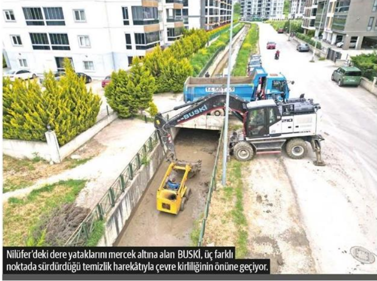
Nilüfer'deki dere yataklarını mercek altına alan BUSKİ, üç farklı noktada sürdürdüğü temizlik harekâtıyla çevre kirliliğinin önüne geçiyor.