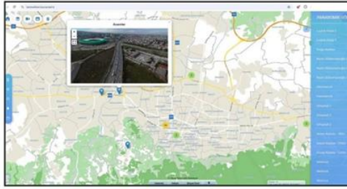
5000'DEN FAZLA ÖNEMLİ NOKTA Uygulama, kent hakkında pek

Bursa Büyükşehir Belediyesi Bilgi İşlem Dairesi Başkanlığı Coğrafi Bilgi Sistemleri Şube Müdürlüğü tarafından vatandaşlara rehber olmasıyla hazırlanan 'Bursa Kent Rehberi', düzenlenen programla belediye personeline anlatıldı.