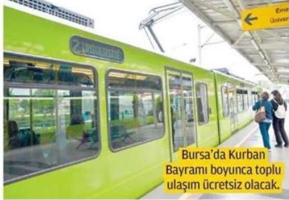
Bursa'da Kurban Bayramı boyunca toplu ulaşım ücretsiz olacak.

Bursa Büyükşehir Belediyesi, bayramda vatandaşların herhangi bir olumsuzlukla karşılaşmaması için her türlü önlemi aldı. Arife günü ile bayramın 4 günü boyunca, Hamitler, Erdoğanköy ve Hasköy mezarlıklarına, 10.15 ile 18.30 saatleri arasında, ücretsiz otobüsler kaldımlacak.