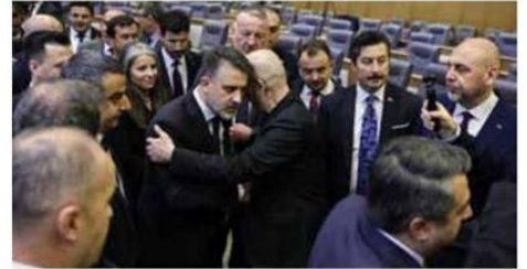
Milliyetçi Hareket Partisi Grup Sözcüsü

"Bursa'nın geleceğine sahip çıkmak hepimizin asli görevidir"