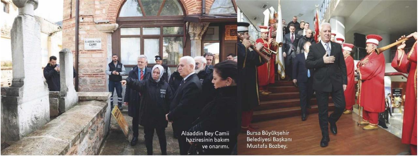
Alaaddin Bey Camii hazinesinin bakım ve onarımı.