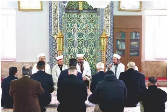
Yenişehir Kumluk Camii'nde mevlit.

700. YIL ETKİNLİKLERİ Bursa Büyükşehir Belediyesi, fethin 700. yılı nedeniyle birçok etkinliğe öncülük ediyor.