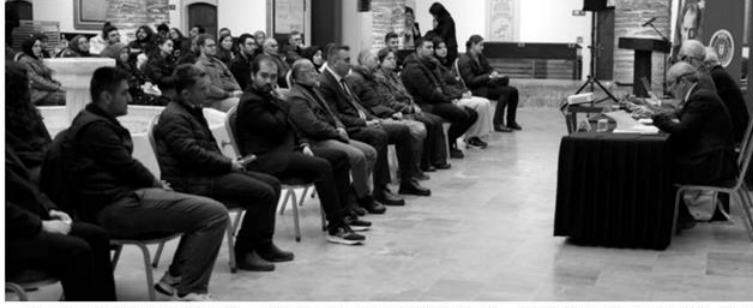
Bursa Büyükşehir Belediyesi tarafından geçmişten günümüze kaybolan kültürel mirası kayıt altına alma hedefiyle başlatılan 'Bursa Bellek- Kent Söyleşileri' kapsamında önem-