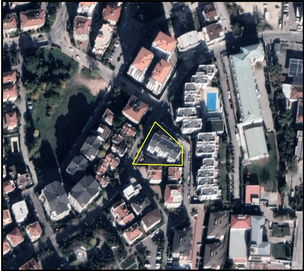
Resim.1- Uydu Görüntüsü

Bursa İli, Nilüfer İlçesi, Konak Mahallesi'nde bulunan yaklaşık 1975 m 2 büyüklüğünde olan planlama alanı yakın çevresinde ağırlıklı olarak konut ve ticaret alanları bulunmakta olup bunun dışında yeşil alanlar, eğitim alanı ve otopark alanı bulunmaktadır.