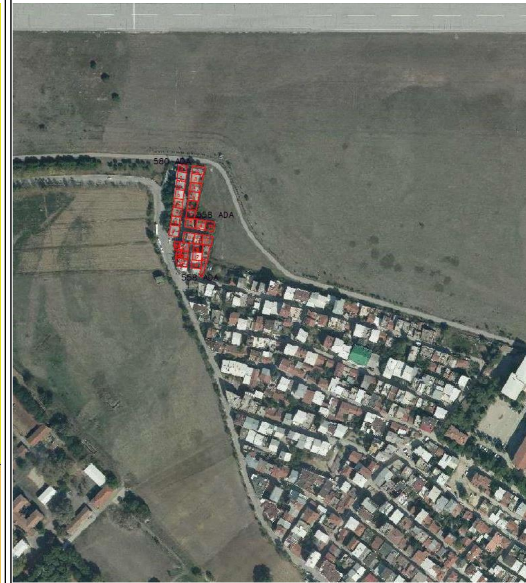
ALAN DAĞILIM TABLOSU