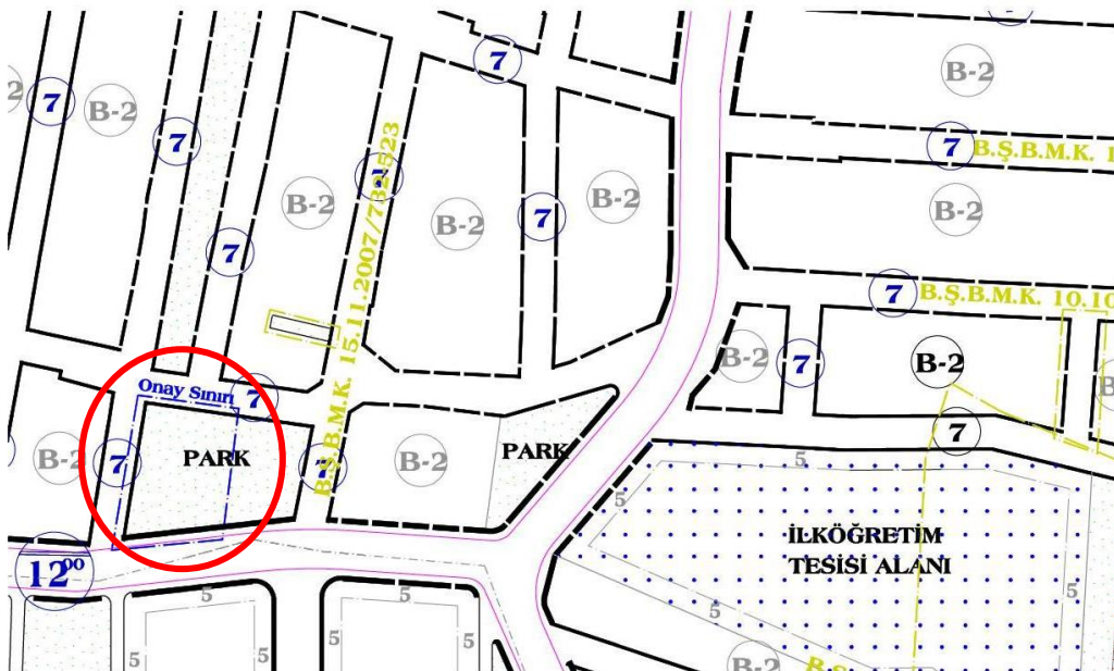
Şekil: Planlama Alanı Güllük-Ortabağlar Bölgesi 1/1000 Ölçekli Uygulama İmar Planı İmar Planındaki Durumu

Plan değişikliğine konu alan, yürürlükteki Güllük-Ortabağlar Bölgesi 1/1000 Ölçekli Uygulama İmar Planı kapsamında kalmakta olup; plan değişikliğine konu alan kısmen “Park” ve kısmen “Otopark” fonksiyonları bulunmaktadır.