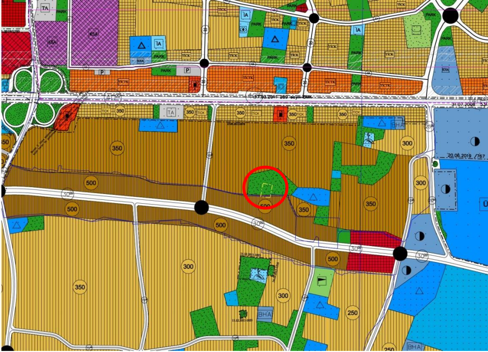
Şekil: Planlama Alanı 1/5000 Ölçekli Nazım İmar Planı İmar Planındaki Durumu