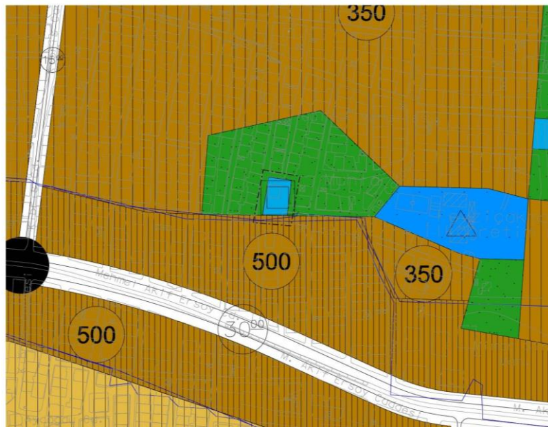
1/5000 Ölçekli Nazım İmar Planı Plan Değişikliği Öneri Çalışması

*Alan hesabı plan değişikliğine konu alan üzerinden yapılmıştır.