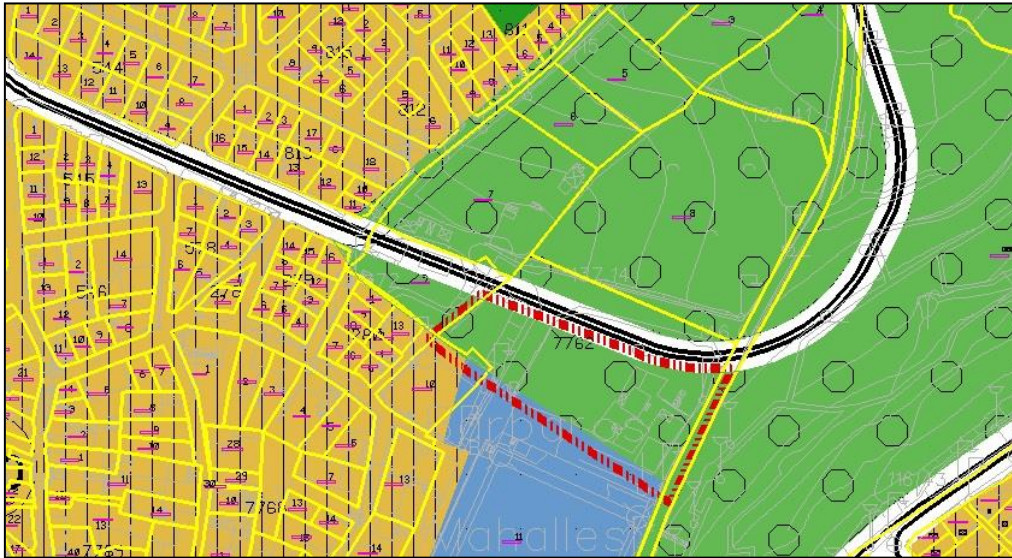
1/5000 Ölçekli Demirtaş Belediyesi Nazım İmar Planı