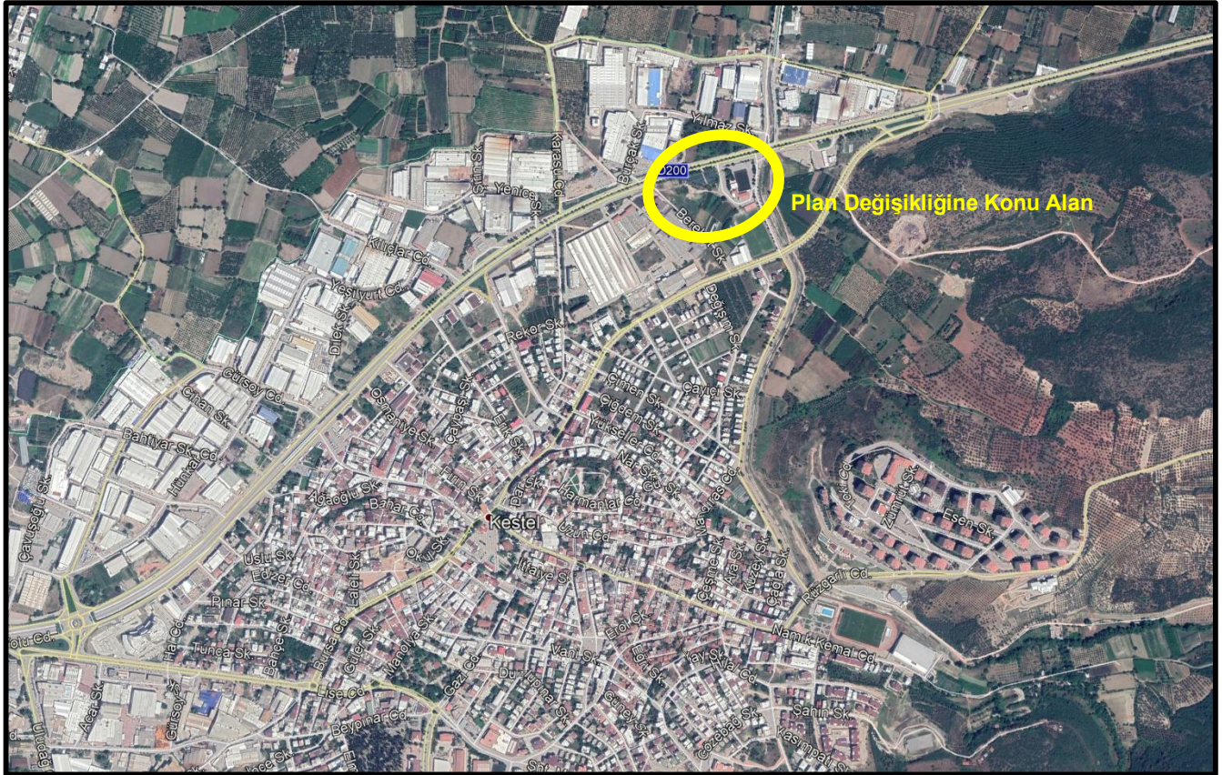
Şekil 1: Plan Değişikliğine Konu Alanın Konumu

Bursa İli, Kestel İlçesi, Kale Mahallesi, 119 Ada, 4-7-8-10 Nolu Parseller onaylı 1/5000 Ölçekli Kestel Nazım İmar Planı kapsamında kalmaktadır.