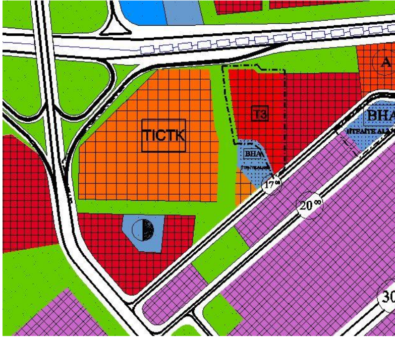
Arazi Kullanım Tablosu

Bursa 3. İdare Mahkemesi tarafından iptal edilen plan değişikliği ile parsel plansız hale gelmiştir. Bu kapsamda söz konusu parselin Ticaret Alanı olarak plan değişikliği hazırlanmıştır.