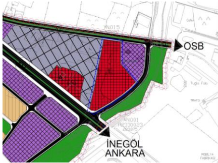
İptal Edilen Plan Değişikliği