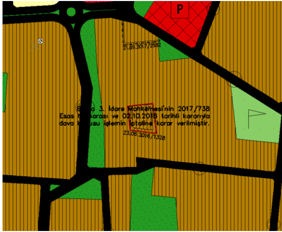
İptal Edilen Plan Değişikliği