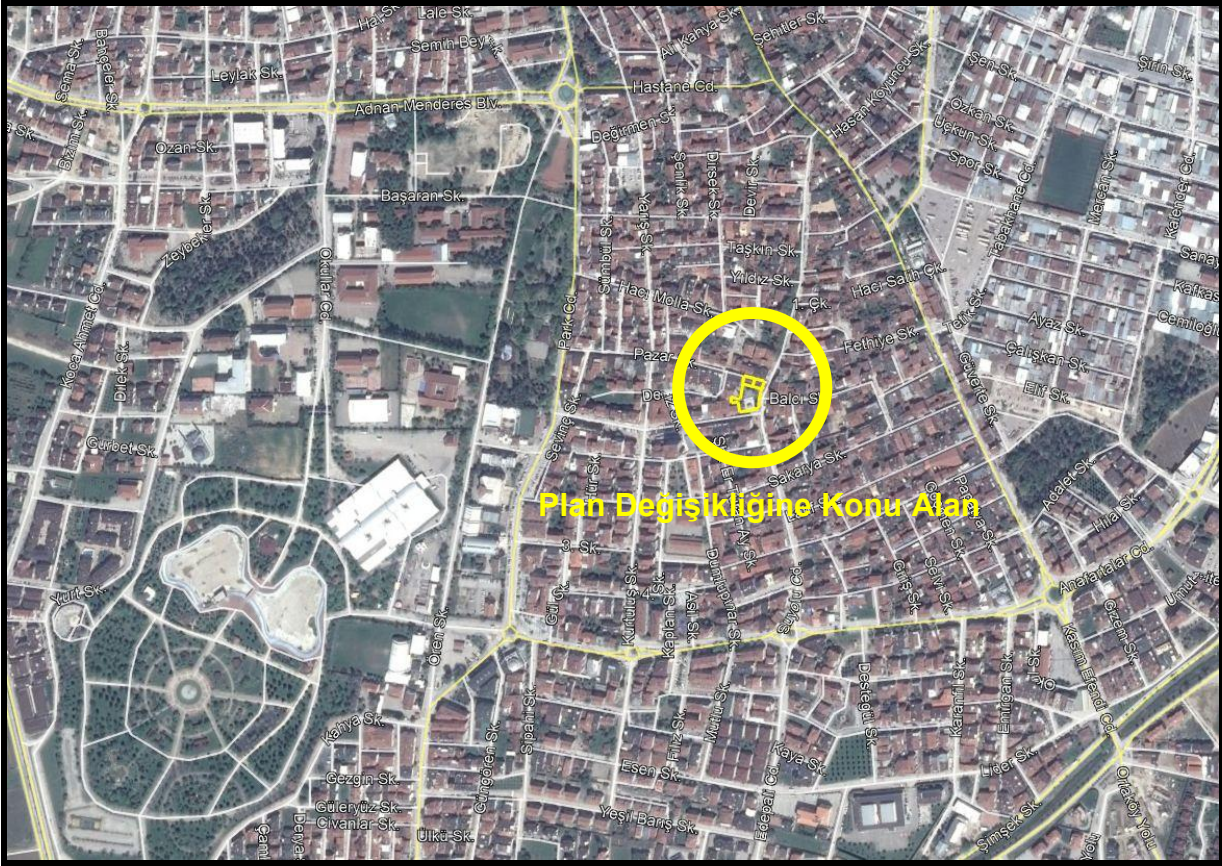
Şekil 1: Plan Değişikliğine Konu Alanların Konumu

Bursa İli, İnegöl İlçesi, Mahmudiye Mahallesi; 776 Ada, 62-64-262 Nolu Parseller; İnegöl Fuar Merkezinin 600 metre kuzeydoğusunda, Zeki Konukoğlu Anadolu Lisenin 550 metre kuzeyinde konumlanmış olup, güney yönünde Cami Sokağı, kuzey yönünde Pazar Sokağı, doğu yönünde Suyolu Caddesine cephelidir.