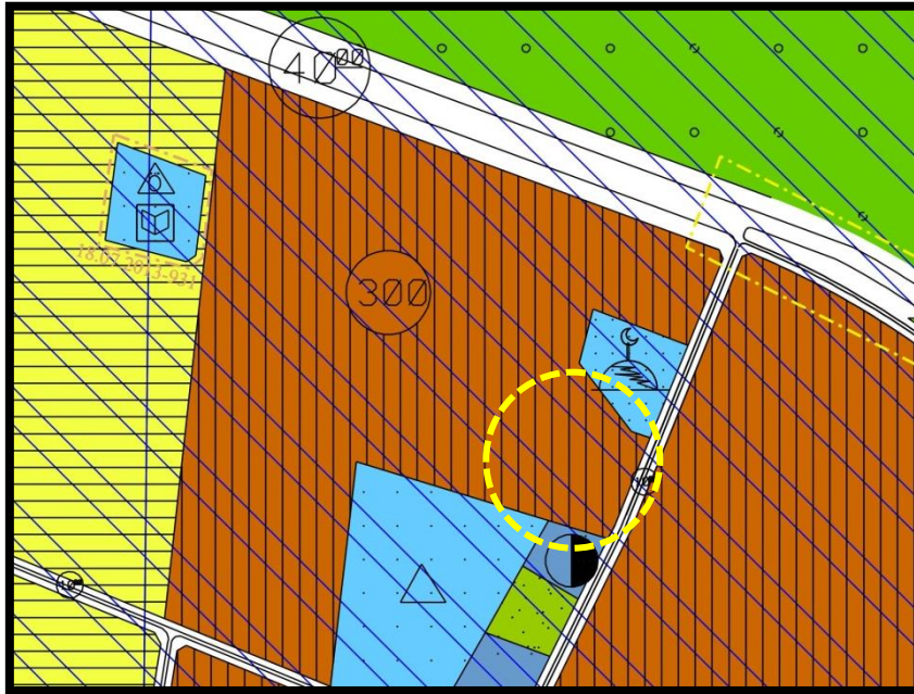
|YÜRÜRLÜKTEKİ 1/5000 ÖLÇEKLİ YILDIRIM NAZIM İMAR PLANI ÖRNEĞİ