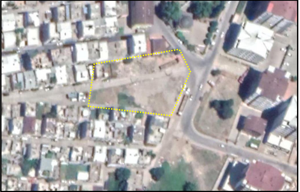
YIKIM SONRASI HAVA FOTOĞRAFI