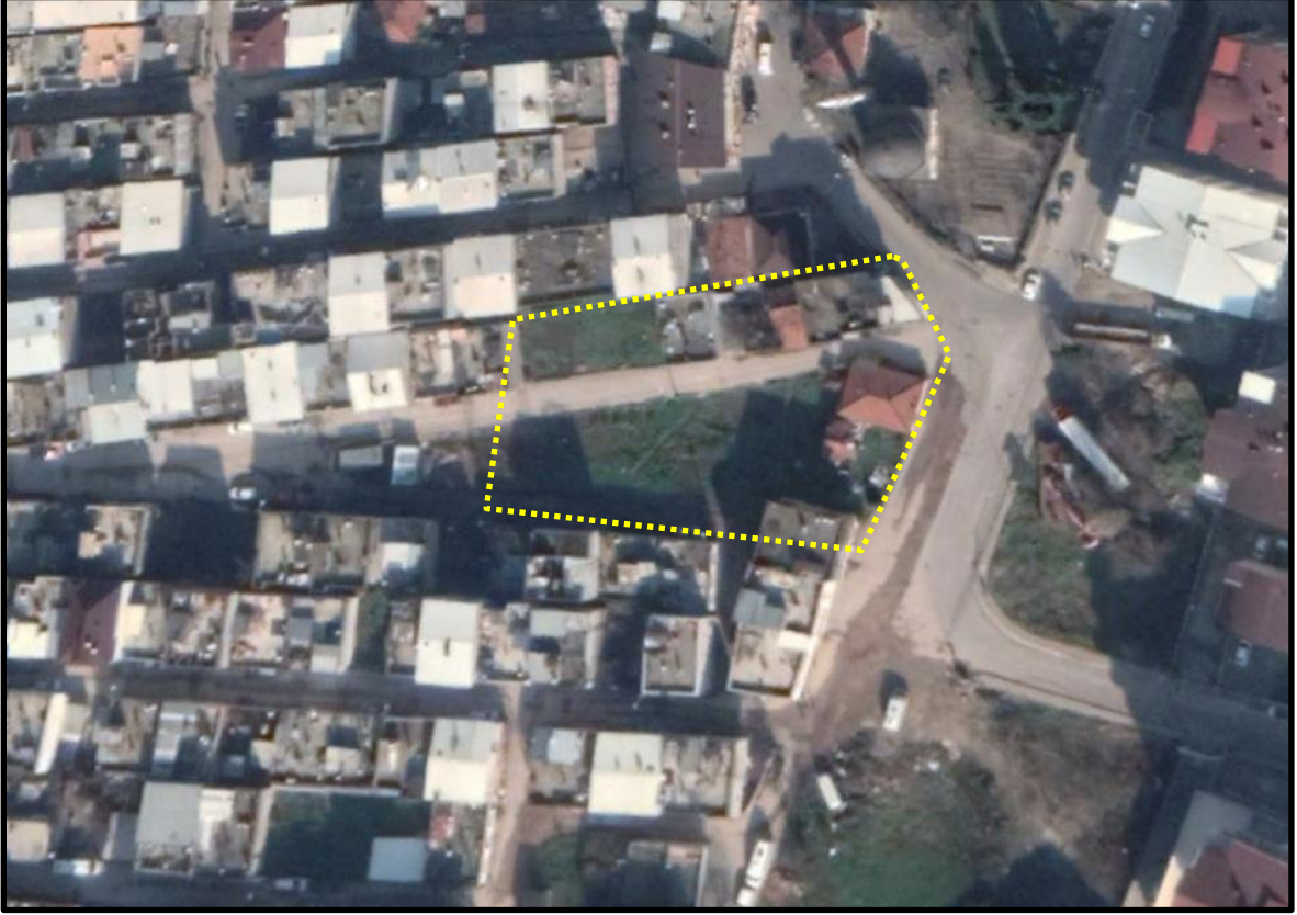
YIKIM ÖNCESİ HAVA FOTOĞRAFI