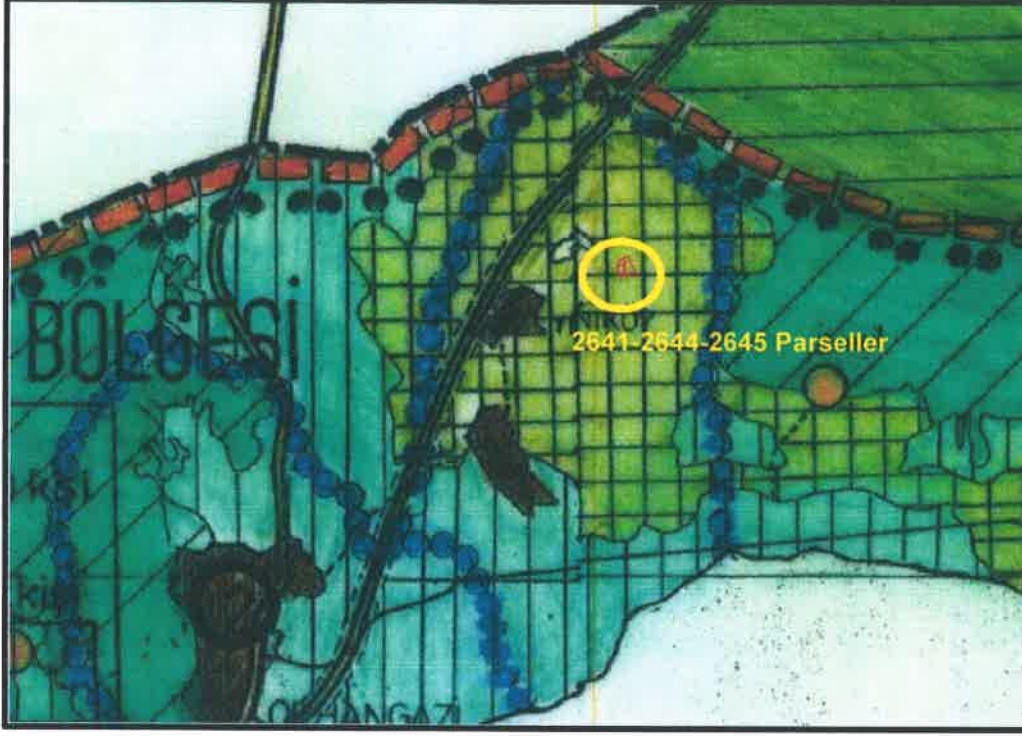
Şekil 2: 1/100 000 Ölçekli Çevre Düzeni Planı Örneği