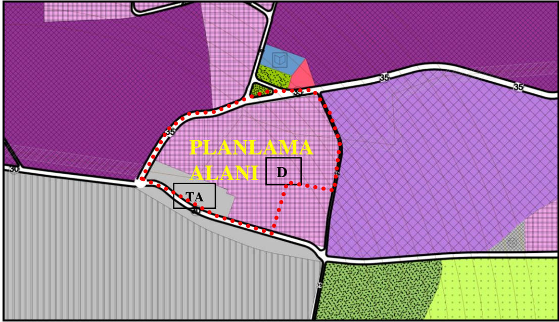
Yürürlük 1/5000 Ölçekli Nazım İmar Planı