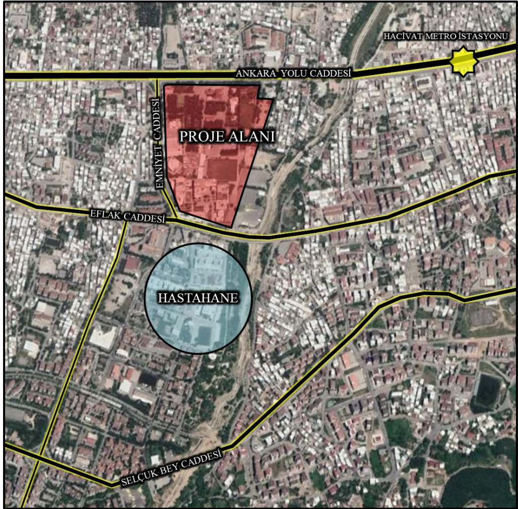
Şekil 1. Planlama Alanının Uydu Görüntüsündeki Yeri

Plan değişikliği talebine konu taşınmaz Bursa İli, Yıldırım İlçesi, Mimar Sinan Mahallesi sınırlarında, Ankara Yolu Caddesinin güneyinde ve Arabayatağı Metro İstasyonu ile Hacıvat Metro İstasyonu arasında konumlanmıştır. Mimar Sinan Bulvarına Cephelidir. Karşı parselinde Bursa Diş Hastanesi yer almaktadır.