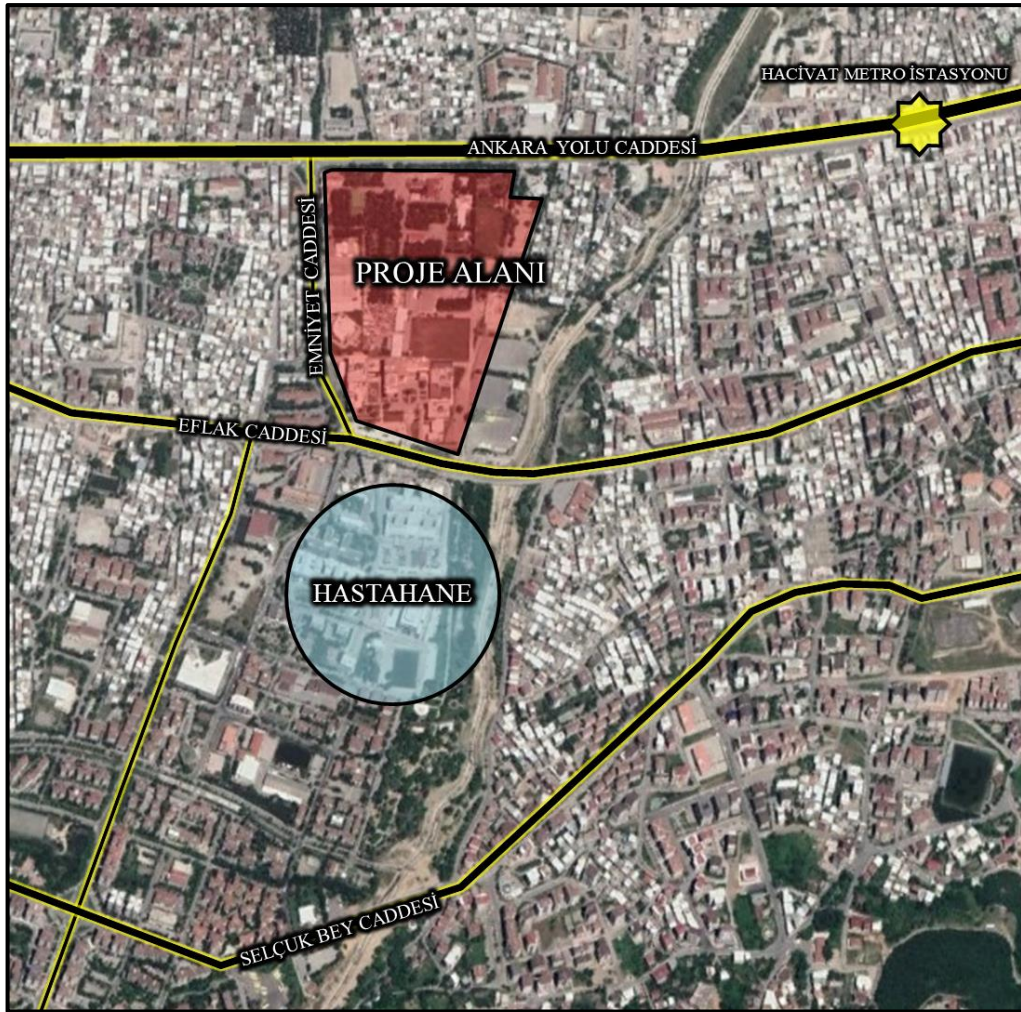
Şekil 1. Planlama Alanının Uydu Görüntüsündeki Yeri

Plan değişikliği talebine konu taşınmaz Bursa İli, Yıldırım İlçesi, Mimar Sinan Mahallesi sınırlarında, Ankara Yolu Caddesinin güneyinde ve Arabayatağı Metro İstasyonu ile Hacıvat Metro İstasyonu arasında konumlanmıştır. Mimar Sinan Bulvarına Cephelidir. Karşı parselinde Bursa Dış Hastanesi yer almaktadır.