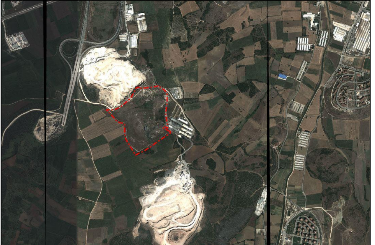
Uydu Görüntüsü (2013)

Planlama alanı Bursa Merkez alanının İzmir Yolu istikametinde İstanbul-İzmir yolu otoyol bağlantı kavşağının güney kısmında yer almaktadır. Bursa il merkezinin batısında, merkeze yaklaşık 20 km. mesafedir.