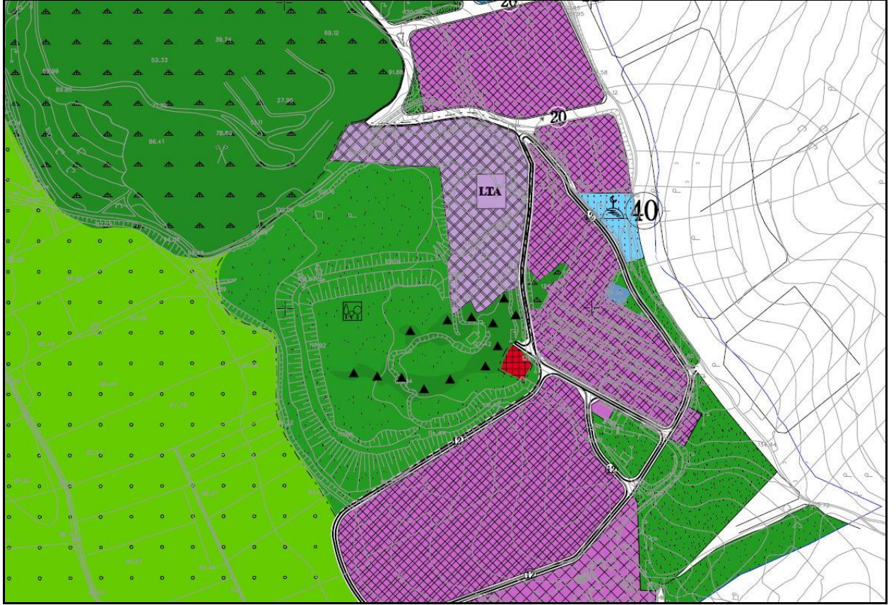
Öneri 1/5000 ölçekli Nazım İmar Planı değişikliği

Bursa 1. İdare Mahkemesi'nin 2017/1471 Esas Numaralı ve 22.11.2018 tarihli kararında belirtilen iptal gerekçelerini ortadan kaldırmak amacıyla Bursa Büyükşehir Belediye Meclisi'nin 26.04.2017 tarih ve 1247 sayılı kararı ile onaylanan plan değişiklik sınırı genişletilmiş ve söz konusu alan "Rekreasyon Alanı, Orman Alanı, Lojistik Tesis Alanı, Yol Alanı" olarak planlanmasına ilişkin 1/5000 ölçekli Nazım İmar Planı değişikliği hazırlanmıştır.