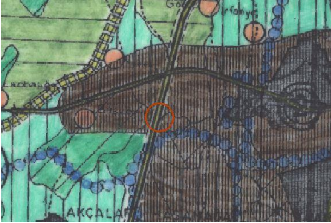
1/100 000 ölçekli Bursa Çevre Düzeni Planı

Plan değişikliğine konu alan, Bursa 2020 yılı 1/100.000 Ölçekli Çevre Düzeni Planında “Batı Planlama Bölgesi” sınırlarında kalmakta olup plan kararlarında “kentsel gelişmenin yönlendirilebileceği alanlar” olarak gösterilmektedir.