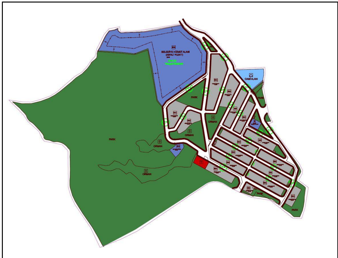
BBBMK=26.04.2017/1247 Öncesi 1/1000 ölçekli UİP