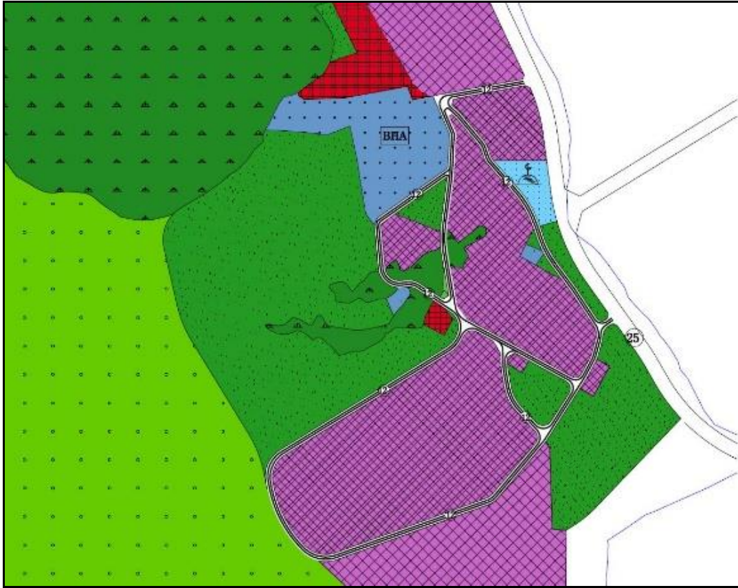
BBBMK=26.04.2017/1247 Öncesi 1/5000 ölçekli NİP