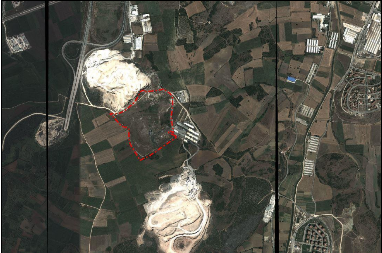
Uydu Görüntüsü (2013)

Planlama alanı Bursa Merkez alanının İzmir Yolu istikametinde İstanbul-İzmir yolu otoyol bağlantı kavşağının güney kısmında yer almaktadır. Bursa il merkezinin batısında, merkeze yaklaşık 20 km. mesafedir.