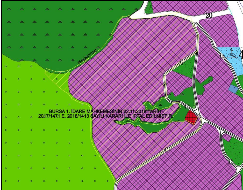
Onaylı 1/5000 ölçekli Akçalar Nazım İmar Planı (BBBMK=26.04.2017/1247)