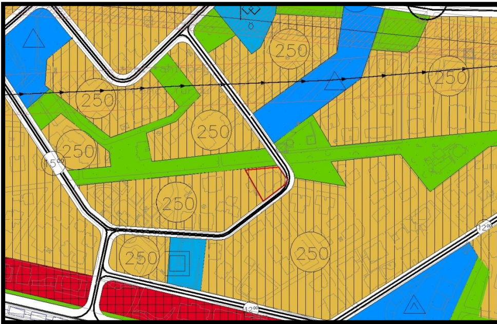
Şekil 5: 1/5000 ölçekli Kentsel Dönüşüm Öncesi Nazım İmar Planı Durumu