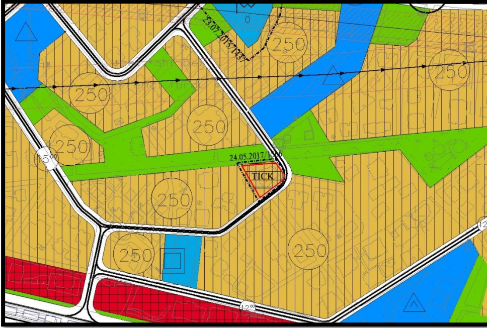
Şekil 4: 1/5000 ölçekli Kentsel Dönüşümüne İlişkin İptal Olan Plan Değişikliği

Planlama alanına ait planlama kararları incelendiğinde 1/5000 Ölçekli Nazım İmar Planında planlama alanı, kentsel dönüşümüne ilişkin plan değişikliği öncesi Konut Alanı planlı olup, Kentsel Dönüşümüne ilişkin plan değişikliği ile "Ticaret-Konut Alanı" olarak planlanmıştır. 24.05.2017/1566 sayı ile onaylanan bu plan değişikliği iptal edilmiştir.