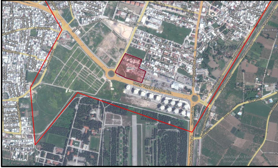
Şekil 2: Planlama Alanının Bölge İçerisindeki Konumu