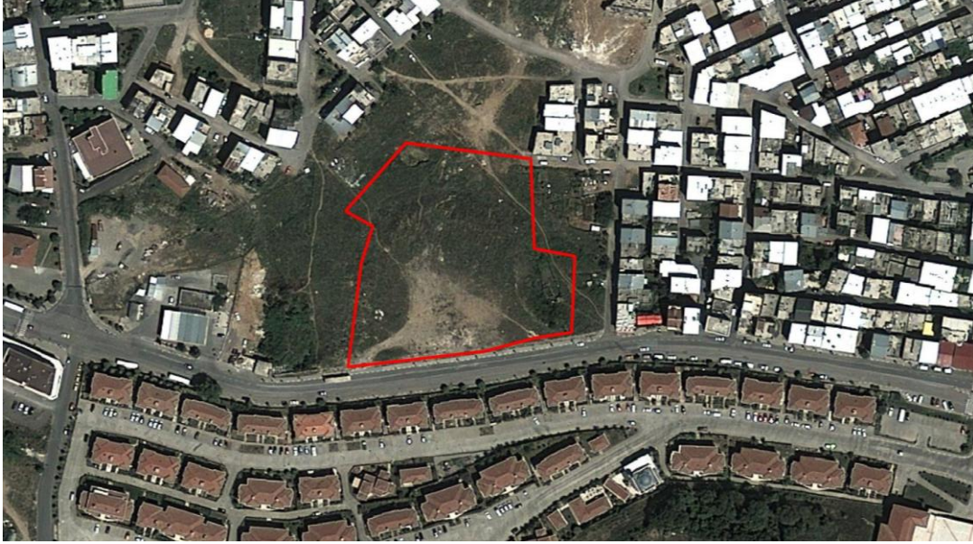
Şekil 1: Taşınmaz Sınırlarını Gösterir Planlama Alanının Konumu

Planlama alanı, Bursa İli, Yıldırım İlçesi, Değirmenlikızık Mahallesi sınırları dâhilinde bulunmaktadır. Yerleşik ilçe alanının güney kısmında bulunan alan, Akçağlayan Konutları kuzeyinde kalmakta ve Çiçek Caddesinden cephe almaktadır.