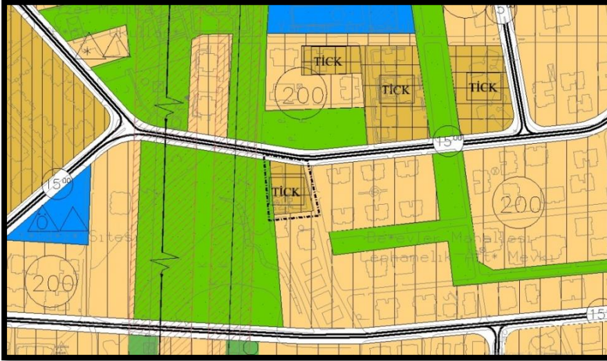
Şekil 6: 705 ada 1 Sayılı Parsele İlişkin 1/5000 Ölçekli Nazım İmar Planı Değişikliği

Bursa Büyükşehir Belediye Meclisi'nin 20.06.2017 tarih ve 1947 sayılı kararıyla onaylanan plan değişikliği öncesinde planlama alanına ait parsel 1/5000 Ölçekli Nazım İmar Planında "Konut Alanı" imarlıdır. Parselde kentsel dönüşüm çalışması devam etmekte olup; planlama aşamasında 1/5000 ölçekli Nazım İmar Planı değişikliği ile 1/1000 ölçekli Uygulama İmar Planı değişikliği birlikte onaylanmıştır. Plan değişikliğine ilişkin mahkeme sürecine istinaden, planlama hiyerarşisinin bozulmaması amacı ile parsel 1/5000 ölçekli nazım imar planında tekrar "Ticaret-Konut Alanı" olarak planlanmıştır. Yapılan değişiklik mevzuat açısından uygunluk taşımaktadır.