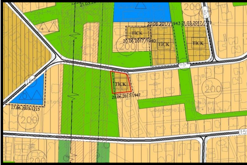
Şekil 5: 1/5000 Ölçekli Kentsel Dönüşüme İlişkin (İptal Edilen) Nazım İmar Planı Durumu