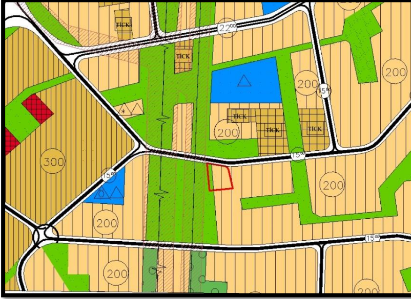
Şekil 4: 1/5000 Ölçekli Kentsel Dönüşüme İlişkin Plan Değişikliği Öncesi Plan Durumu

Kentsel Dönüşüme İlişkin Plan Değişikliği öncesi "Konut Alanı" planlı olan parsel, Kentsel Dönüşüme İlişkin Plan Değişikliği ile "Ticaret-Konut Alanı" olarak planlanmış, ancak bu plan değişikliği iptal edilmiştir.