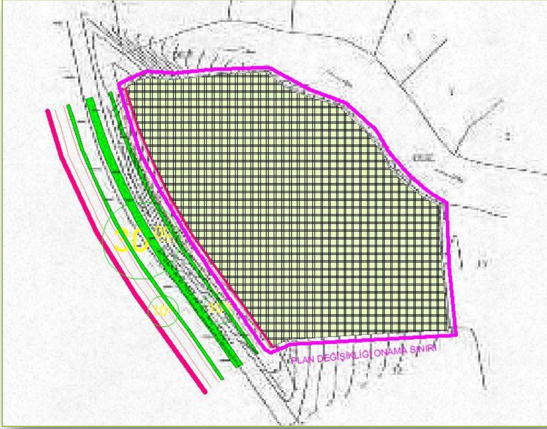
Pafta-2: 101 Ada, 34 Parselin 1/5000 Ölçekli Nazım İmar Planı Değişikliği