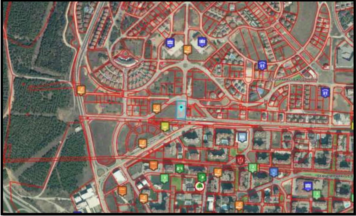
Şekil 1: Planlama Alanının Bölge İçerisindeki Konumu

Bursa İli, Nilüfer İlçesi, Özlüce Mahallesi'nde bulunan yaklaşık 2807,91 m 2 büyüklüğünde olan planlama alanı yakın çevresinde spor ve park alanları bulunmaktadır.