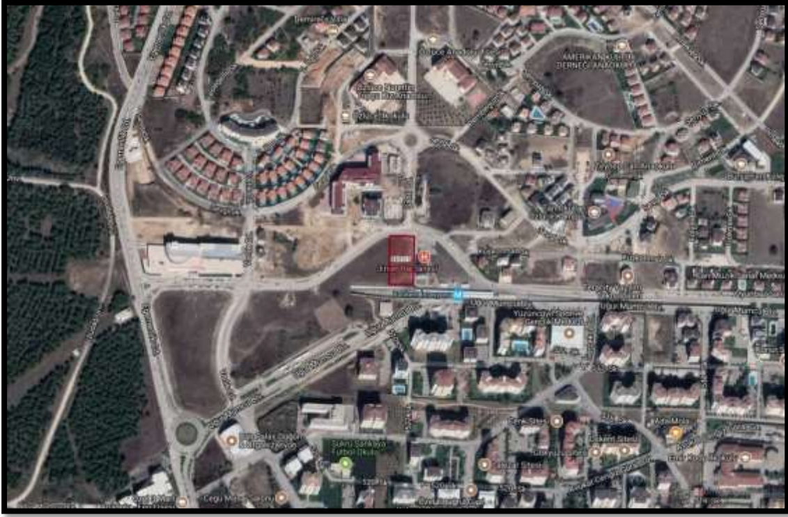
Şekil 2: Planlama Alanının Ulaşım İlişkileri