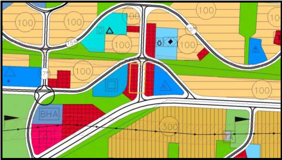
Şekil 4: 1/5000 ölçekli Nazım İmar Planı Durumu

Planlama alanına ait planlama kararları incelendiğinde 1/5000 Ölçekli Nazım İmar Planında parsel "Tali İş Merkezi" olarak planlıdır.