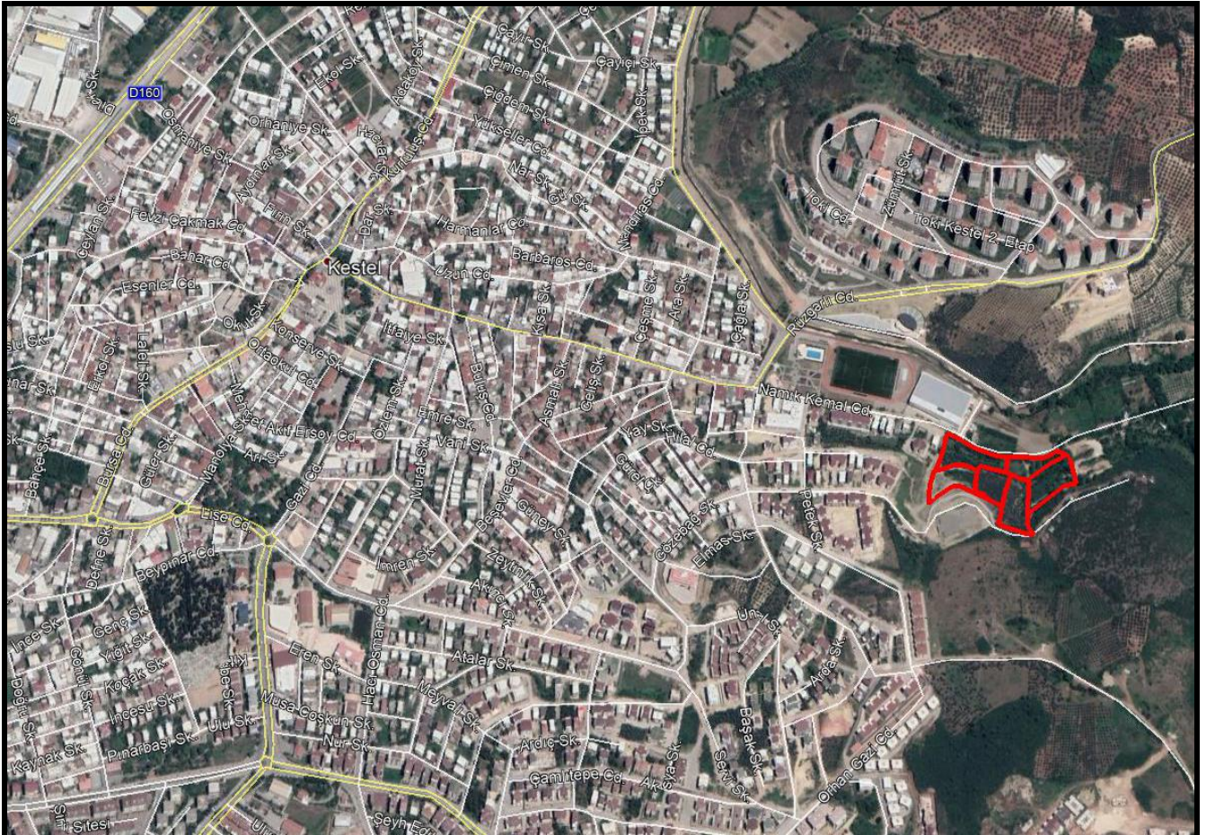
Şekil 1: Plan Değişikliğine Konu Alanın Konumu

Bursa İli, Kestel İlçesi, Vani Mehmet Mahallesi, 325 Ada 180-181-182-184-210-223 Nolu Parseller; Kestel ilçe merkezinin doğusunda konumlanmış olup, Namık Kemal Caddesine cephelidir.