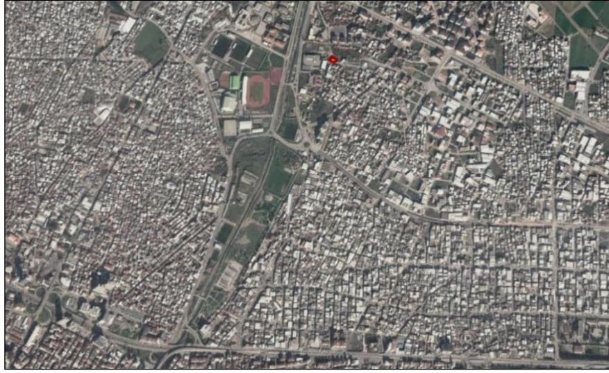
Resim.1- Uydu Görüntüsü

Vatan Mahallesi Bursa Merkezinin doğusunda, Yıldırım Belediyesi sınırlarında bulunmaktadır. Plan değişikliği hazırlanan alan konumu itibarı ile parsel Vatan Caddesi ve Vatan-2 Caddesi arasında kalmakta olup, Kent Sokak ile Aslı Sokak'ın birleştiği güneybatı köşesinde yer almaktadır. Plan değişikliği hazırlanan parseller 1295 m 2 büyüklüğündedir.