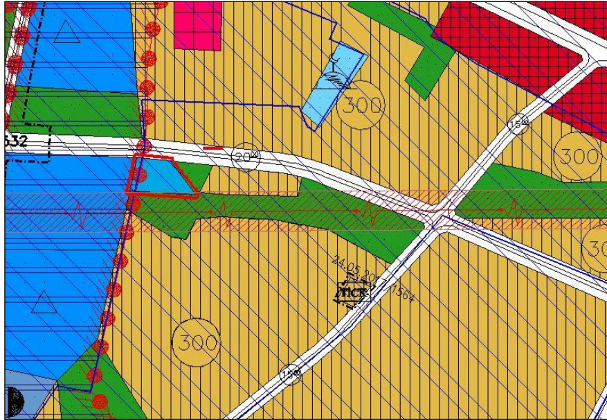
Harita.1- 1/5000 Ölçekli Nazım İmar Planı Durumu

Plan değişikliğine konu parseller 1/5000 ölçekli Yıldırım Nazım İmar Planı kapsamında "Sağlık Tesis Alanı" olarak planlıdır.