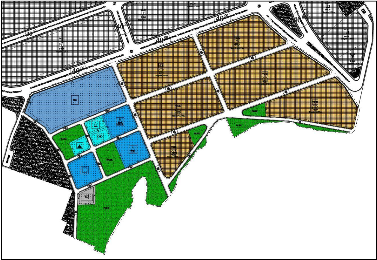
Onaylı 1/1000 Ölçekli Uygulama İmar Planı

Bursa Büyükşehir Belediye Meclisi'nin 13.06.2018 tarih ve 1660 sayılı kararı ile onaylı 1/1000 ölçekli Başköy Ticaret Merkezi Uygulama İmar Planında Nilüfer İlçesi, Başköy Mahallesi, 7498 ada 1-2-3 parseller “Belediye Hizmet Alanı”, “Park Alanı”, “Kreş Alanı”, “İlkokul Alanı”, “Ortaokul Alanı”, “Cami Alanı”, “Sağlık Tesis Alanı”, “Teknik Altyapı Alanı”, “Sosyal Tesis Alanı” olarak, 7498 ada 4 parsel ise E:1,50, Yençok: 12,50 m yapılaşma koşullu “Ticaret+Konut Alanı” ve “Park Alanı” olarak planlıdır.