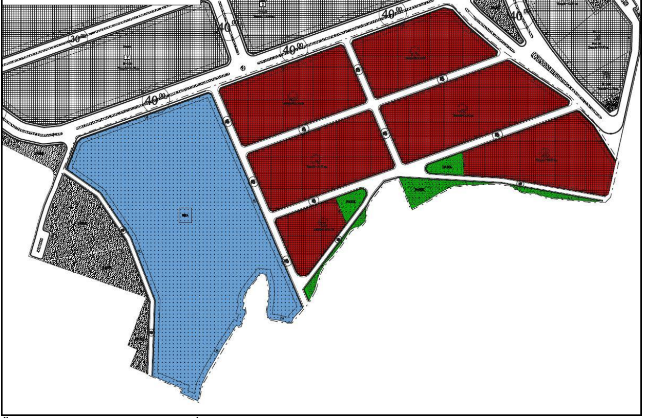
Öneri 1/1000 ölçekli Uygulama İmar Planı

önerilmediğinden donatı alanına ihtiyaç duyulmamış bu sebeple söz konusu alan 1660 sayılı Büyükşehir Belediye Meclis kararı öncesindeki hali olan “Belediye Hizmet Alanı” olarak planlanmıştır