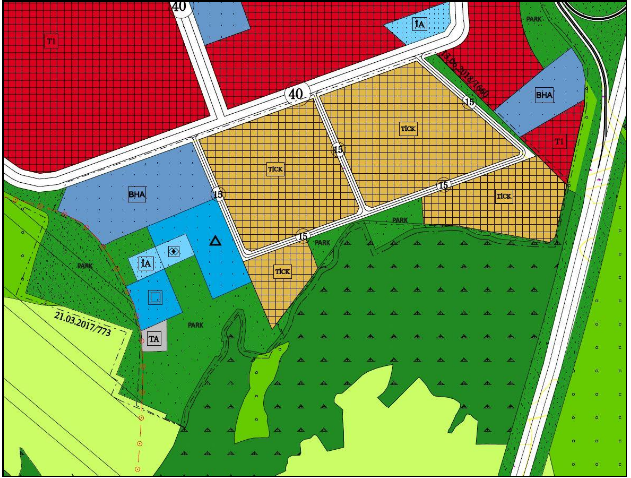
Onaylı 1/5000 Ölçekli Nazım İmar Planı