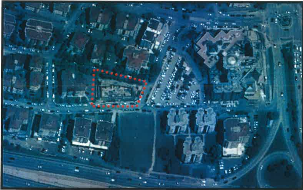
YIKILDIKTAN SONRAKİ UYDU GÖRÜNTÜSÜ