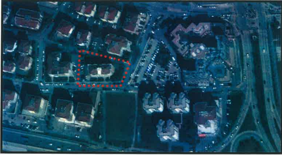
YIKILMADAN ÖNCEKİ UYDU GÖRÜNTÜSÜ