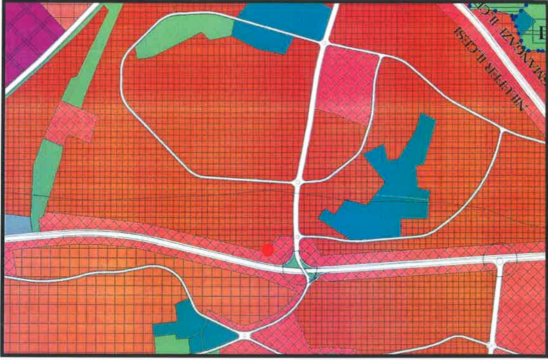
YÜRÜRLÜKTEKİ BBŞB MERKEZ PLANLAMA BÖLGESİ 1/25000 ÖLÇEKLİ NİP ÖRNEĞİ