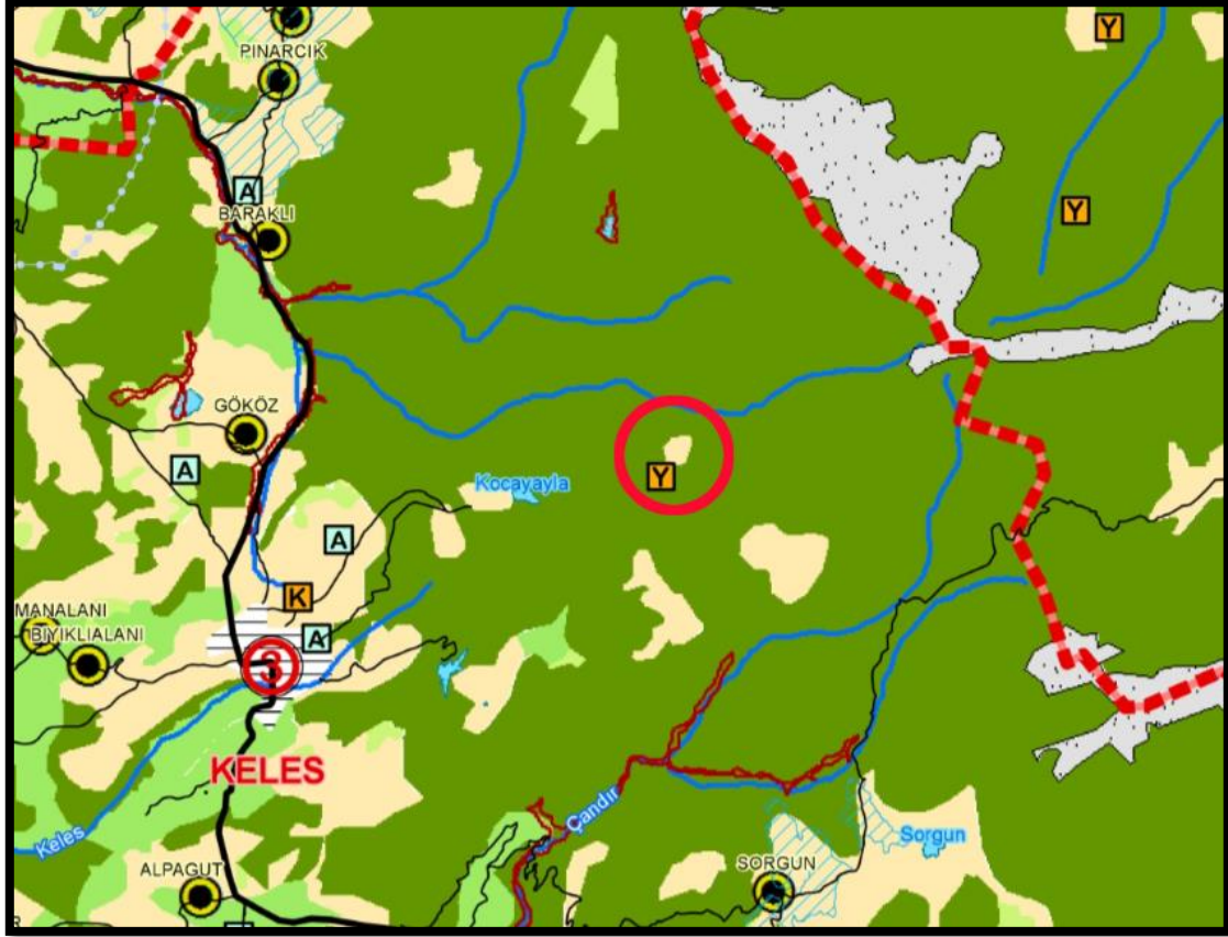
Şekil 4: Planlama Alanının Onaylanan 1/100.000 ölçekli 2030 Yılı Bursa Çevre Düzeni Planı İçindeki Yeri

Proje 4.10.1.1. Dağ köylerini geliştirme projesinde; BEBKA yürütücülüğünde Tarım ve tarım dışı faaliyetlerle (eko-turizm, agro-turizm, yayla turizmi, ev pansiyonculuğu) ekonomik kalkınmanın desteklenmesi hedeflenmiştir.