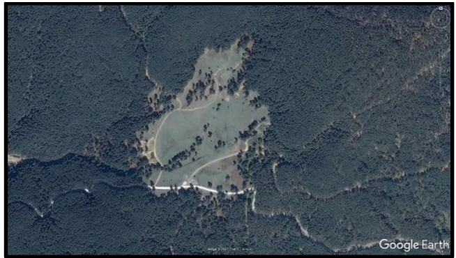
Şekil 1: Planlama Alanının Bölge İçerisindeki Konumu