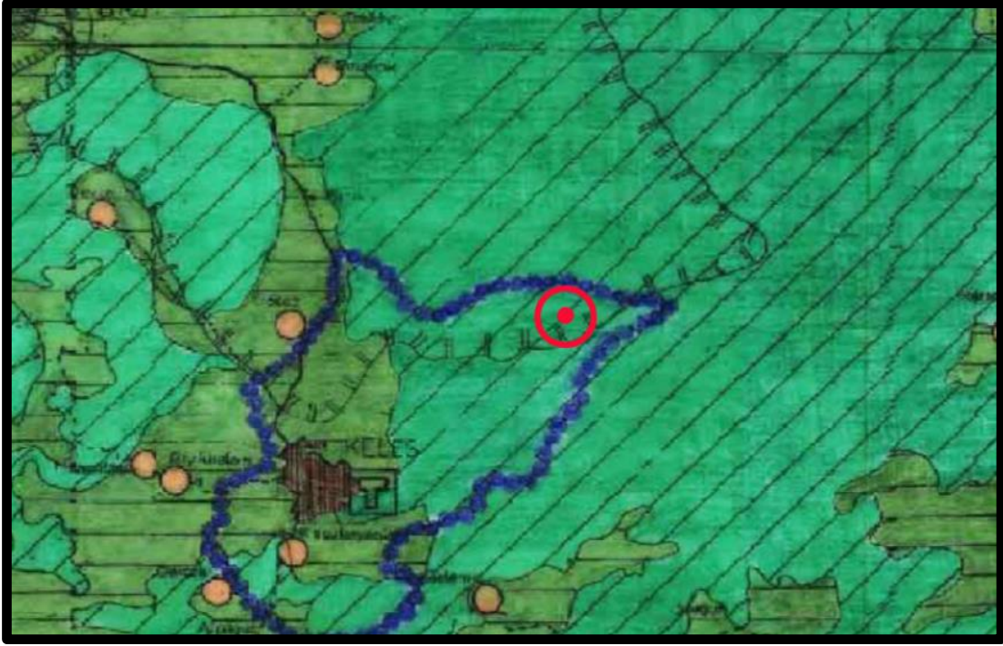
Şekil 3: Planlama Alanının Yürürlükteki 1/100.000 ölçekli 2020 Yılı Bursa Çevre Düzeni Planı İçindeki Yeri

“6.2.13.e. Keles ilçesi Kocayayla mevkiinde yayla turizmi ve rekreasyon, Oylat ve Akarca’da termal turizm faaliyetleri geliştirilecektir.” Maddesi ile Kocayayla Mevkiinde yer alan planlama alanımız olan Kendir Yaylası’nda özellikle Yayla Turizm faaliyetlerini geliştirmek hedef olarak sayılmıştır.