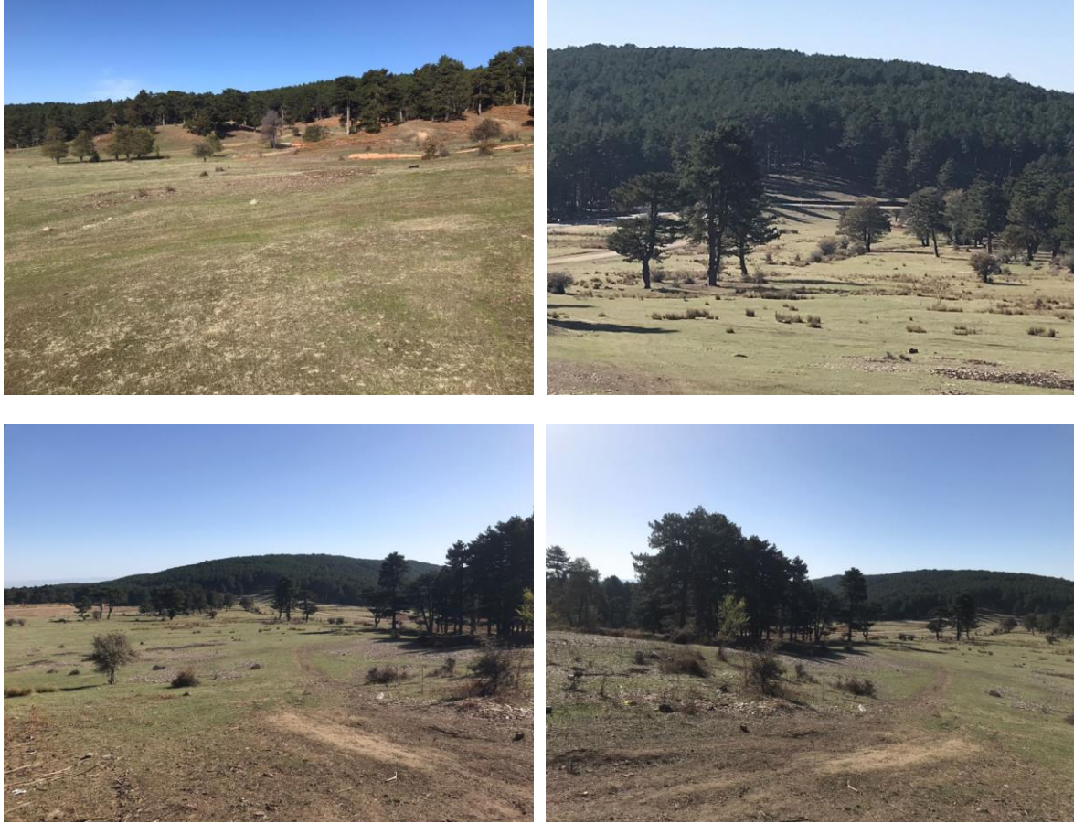
Şekil 2: Alan Görüntüleri

Planlama alanında mevcutta yapılaşma olmayıp yayla niteliğindedir. Parsel, orman alanları ile çevrili olup en yakın yapılaşma alanı 10 km mesafede yer almaktadır.