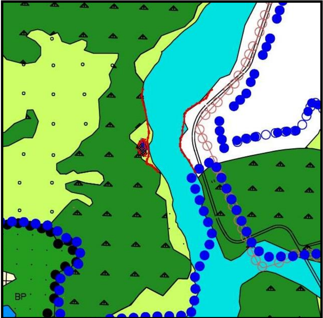
ÖNERİLEN 1/25000 ÖLÇEKLİ İNEGÖL ÇEVRE DÜZENİ PLANI REVİZYONU ÖRNEĞİ