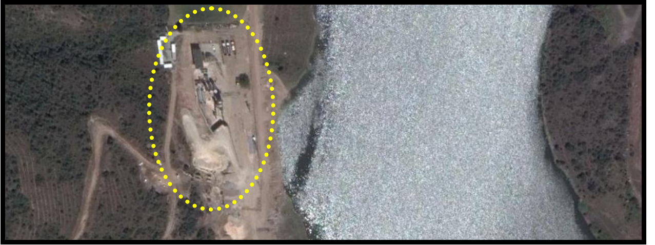
PLANLAMA ALANI YAKIN UYDU GÖRÜNTÜSÜ