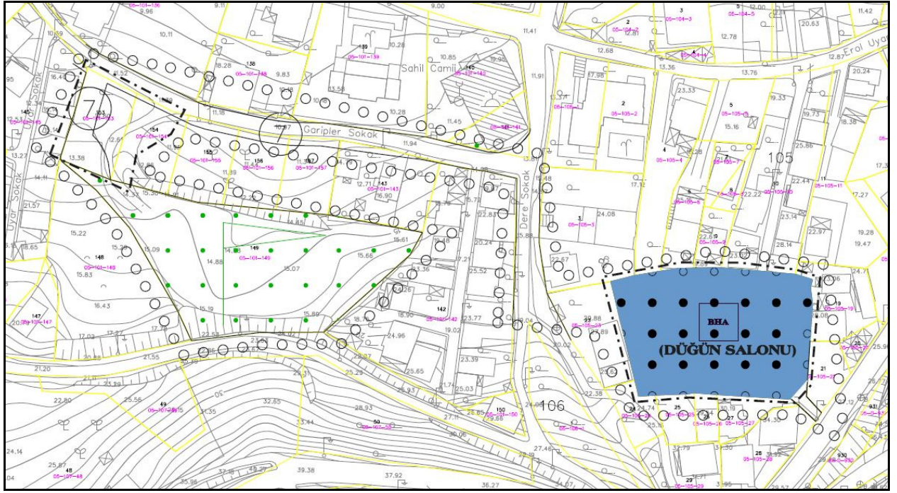
Öneri 1/1000 Ölçekli Uygulama İmar Planı