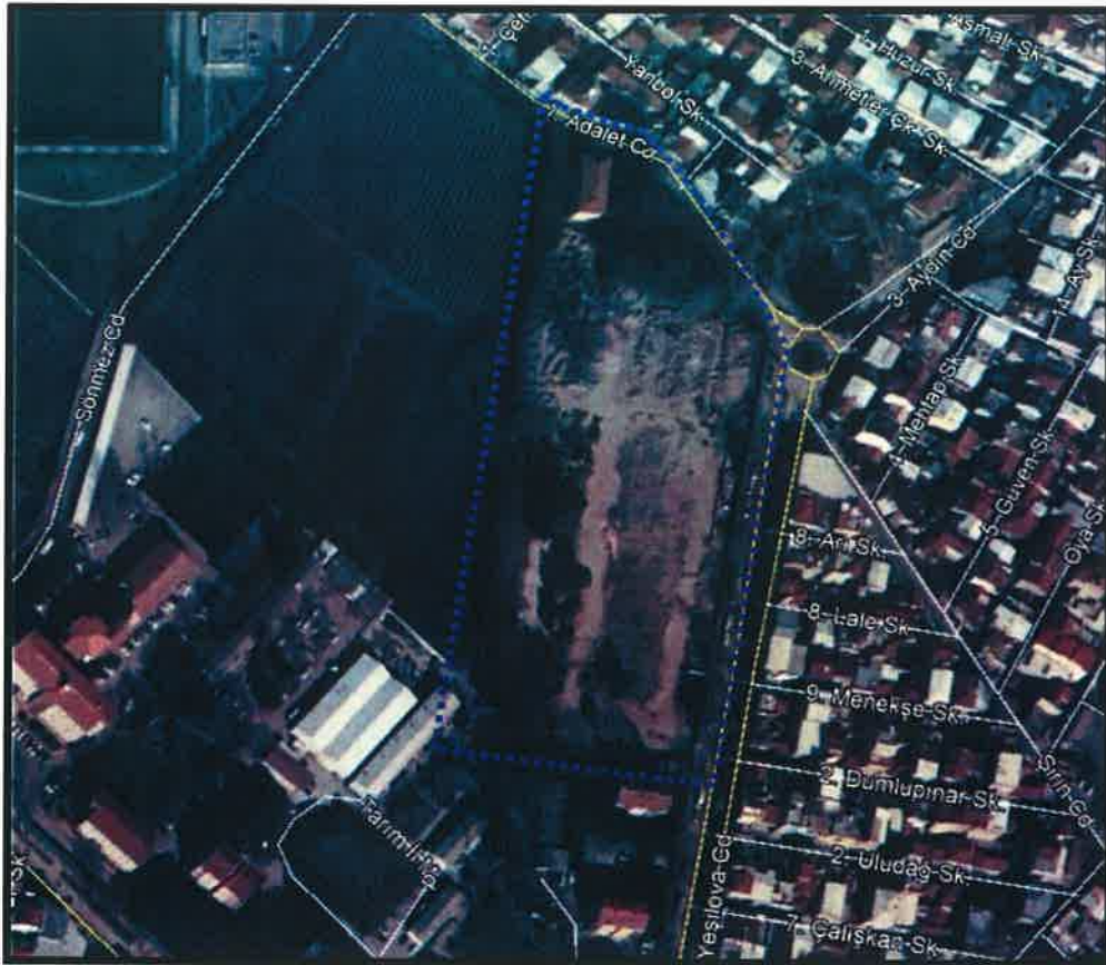
YIKIM SONRASI UYDU FOTOĞRAFI