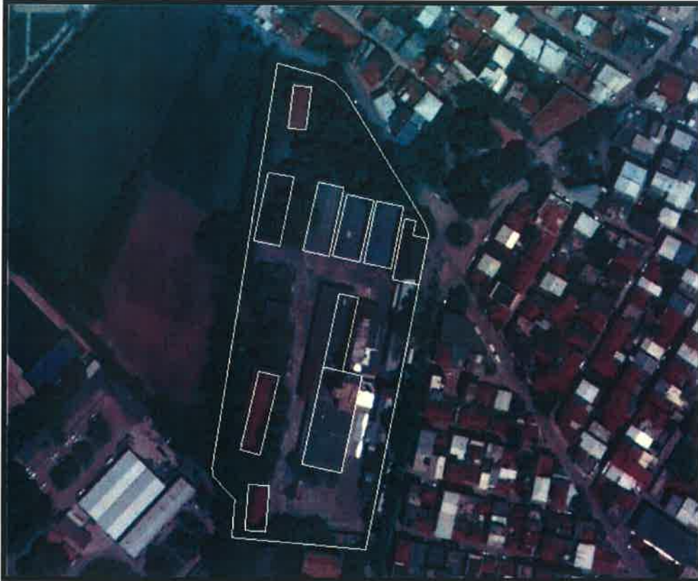
UYDU GÖRÜNTÜSÜNDE PARSEL ÜZERİNDEKİ MEVCUT YAPILAR