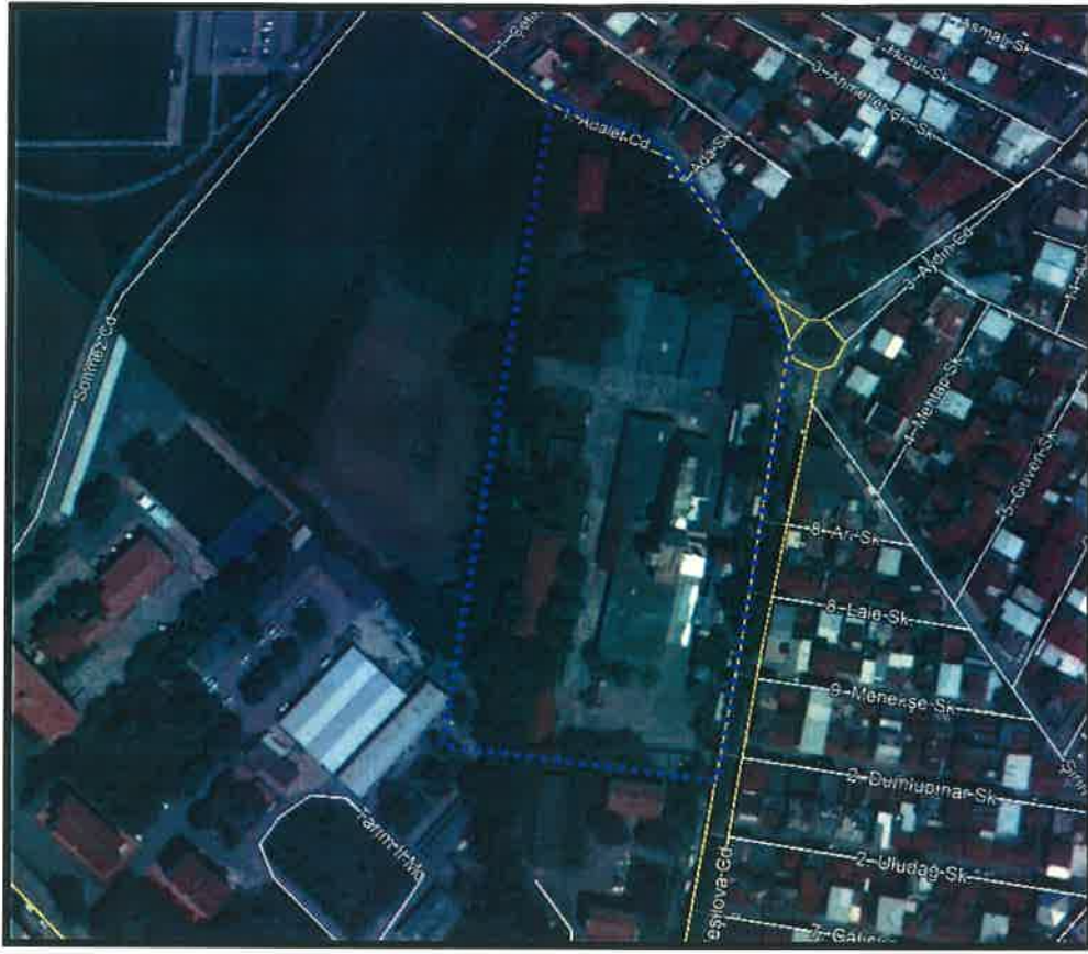
YIKIM ÖNCESİ UYDU FOTOĞRAFI