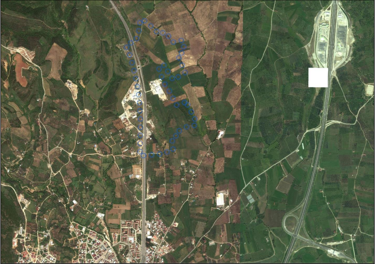
Planlama Alanı Uydu Görüntüsü

Planlama alanı konum olarak Cihanköy Mahallesi'nin 2,5 km güneybatısında, Orhangazi şehir merkezinin yaklaşık 2,7 km kuzeydoğusunda, Gemlik şehir merkezinin yaklaşık 16 km kuzeydoğusunda ve Bursa-Yalova Yolu üzerinde yer almaktadır. Söz konusu alan 716773.16 m 2 büyüklüğündedir.