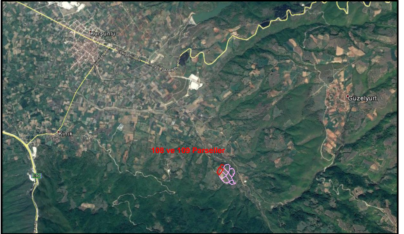
Şekil 1: 179 Ada, 108 ve 109 Nolu Parseller Konumu

Bursa İli, İnegöl İlçesi, Kurşunlu Mahallesi, tapunun H23d.25c. Pafta, 179 Ada, 108 ve 109 Nolu Parseller; Kurşunlu Mahallesinin güneydoğusunda konumlanmıştır. Söz konusu alanın yaklaşık 2,5 km batısında Özlüce Mahallesi, 2 km kuzeydoğusunda ise Güzelyurt Mahallesi bulunmaktadır.