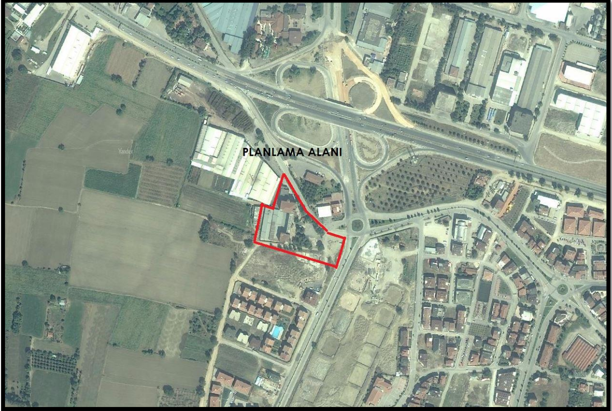
Şekil 1: Planlama Alanının Bölge İçerisindeki Konumu

Bursa İli, İnegöl İlçesi, Süleymaniye Mahallesi'nde bulunan yaklaşık 11793,04 m 2 büyüklüğünde olan planlama alanı yakın çevresinde konut alanları, OSB, park alanları bulunmaktadır.