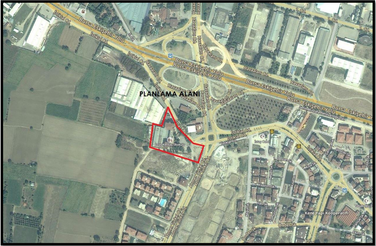
Şekil 2: Planlama Alanının Ulaşım İlişkileri